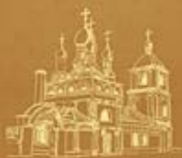
Храм Успения Пресвятой Богородицы в Гончарах Болгарское подворье